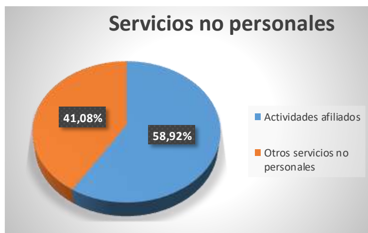
Gráfico 4: Representación gráfica de la composición porcentual de los servicios no personales, según el presupuesto ordinario sindical anual 2026.