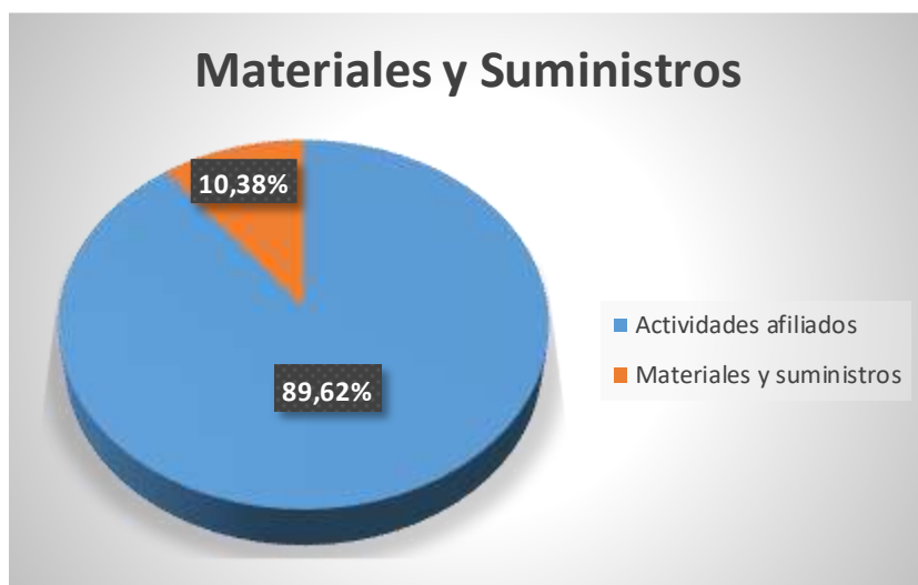
Gráfico 5: Representación gráfica de la composición porcentual de los materiales y suministros, según el presupuesto ordinario sindical anual 2026.