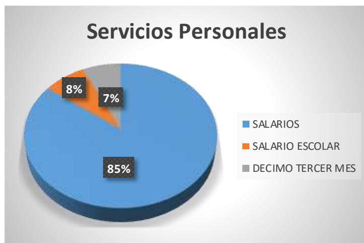
Gráfico 3: Representación gráfica de la composición porcentual de los servicios personales, según el presupuesto ordinario sindical anual 2026.